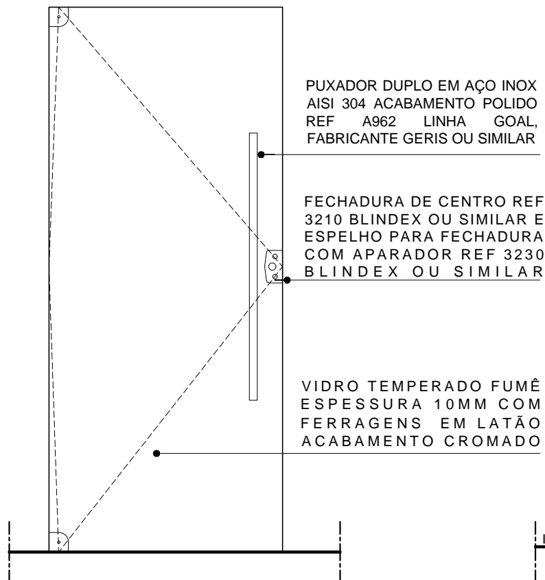
2 ELEVÇÃO - PV1 ESCALA: 1/20